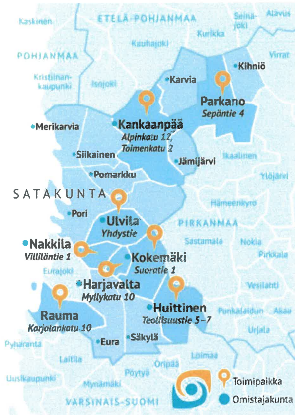
Kuvio 1. Satakunnan koulutuskuntayhtymän jäsenkunnat v. 2023